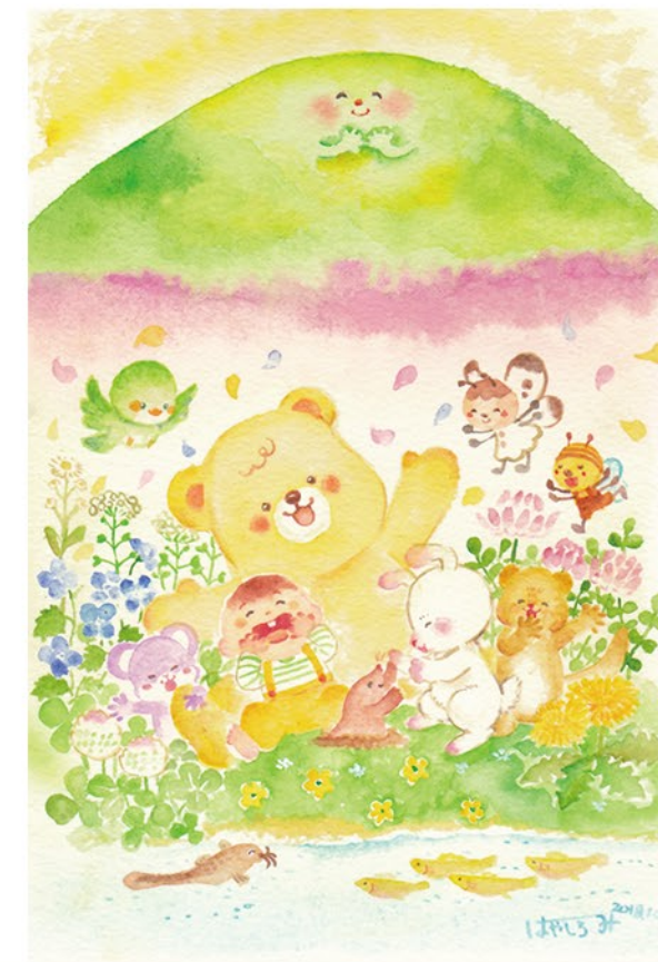
▲オリジナル 『ゆりかごのうた』『はるがきた』(2020) tool : 水彩絵の具, Adobe Photoshop