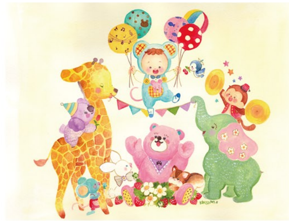
▲オリジナル 『まったりよ!』(2020) tool : 水彩絵の具