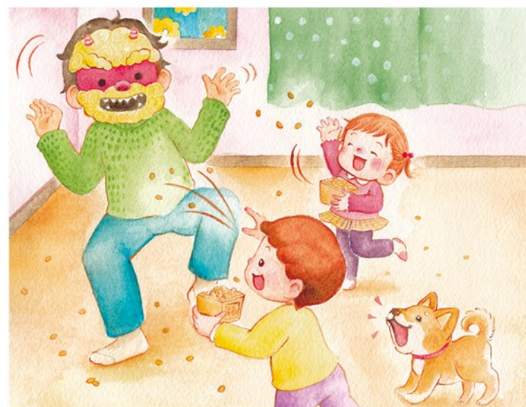
▲チャイルド本社様 チャイルドブック・ゴールド「節分」