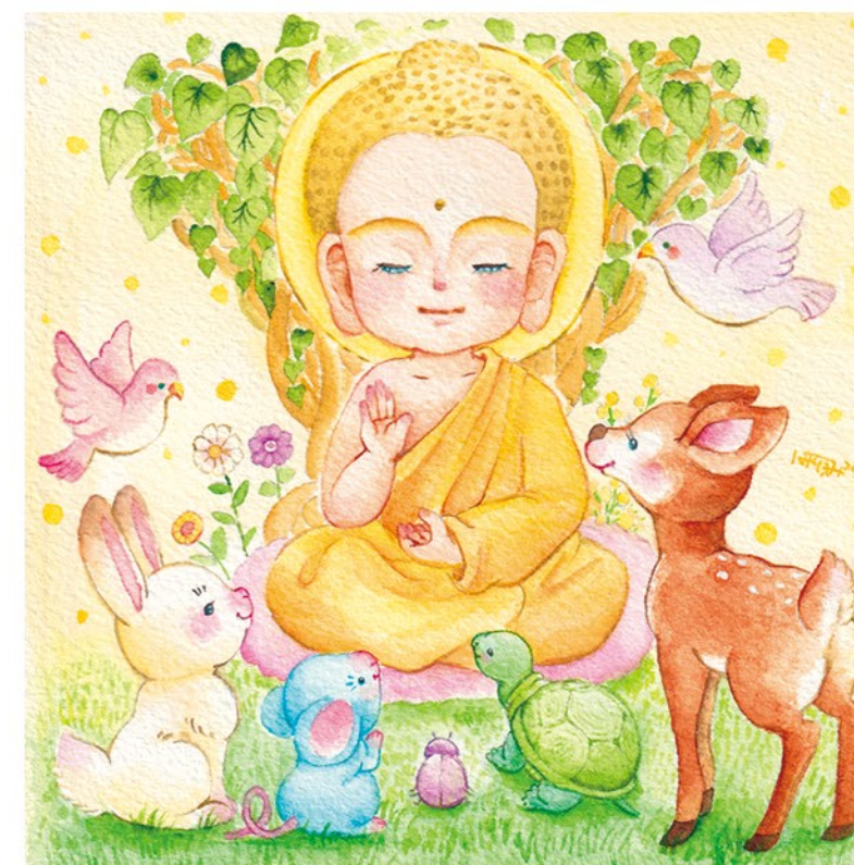
▲直七法衣店様 ナオシチ学習帳 表紙絵『初転法輪図』 4C