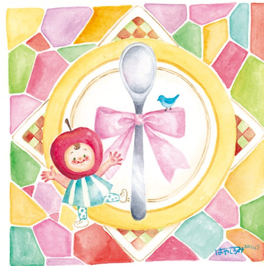
▲オリジナル 『ご出産祝いプレゼントの絵』(2020) tool : 水彩絵の具