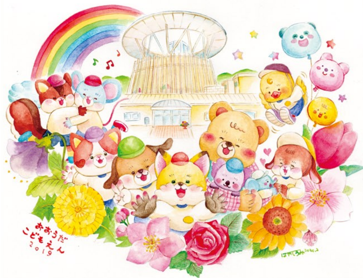
▲オリジナル こどもえんPTA広報誌『つみき』表紙イラスト(2019~2020) tool : 水彩絵の具