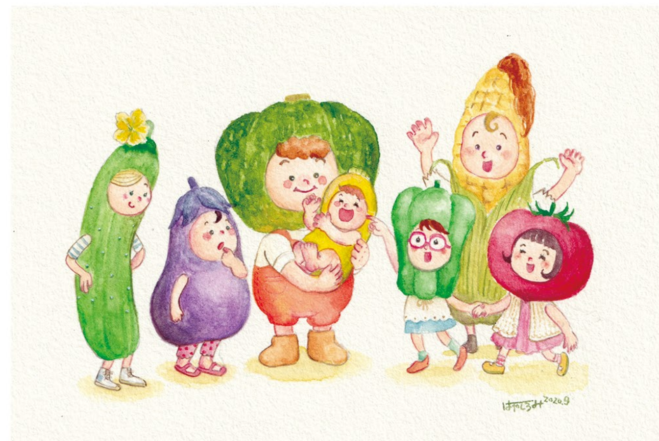
▲オリジナル 『はじめてまして!ズッキーニです』 (2020) tool: 水彩絵の具