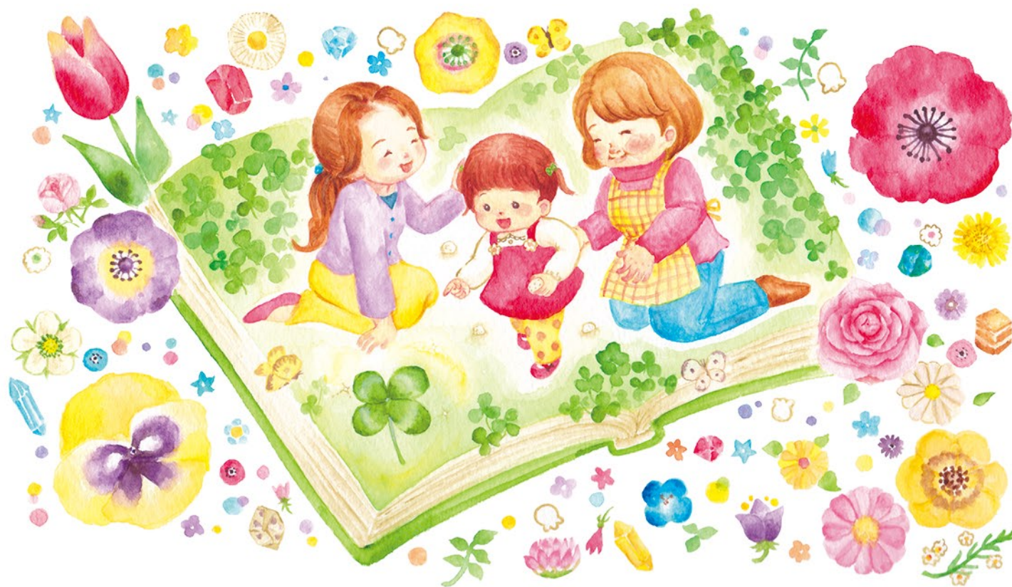
▲ノース・スターズ・ピクチャーズ様 絵本冊子『ボノロン』内 挿絵 4C