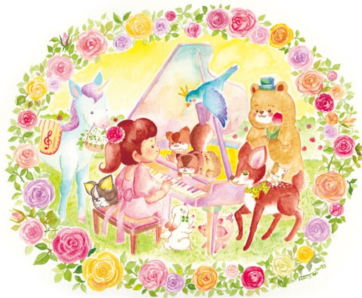
▲オリジナル 『虹色のピアノ』(2018) tool : 水彩絵の具