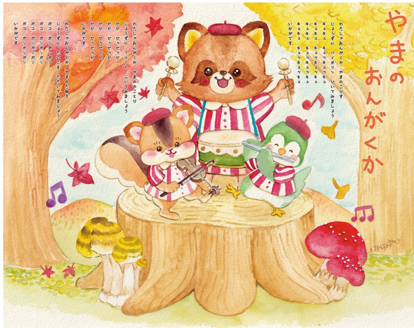
▲オリジナル 『やまのおんがくか』 (2020) tool: 水彩絵の具