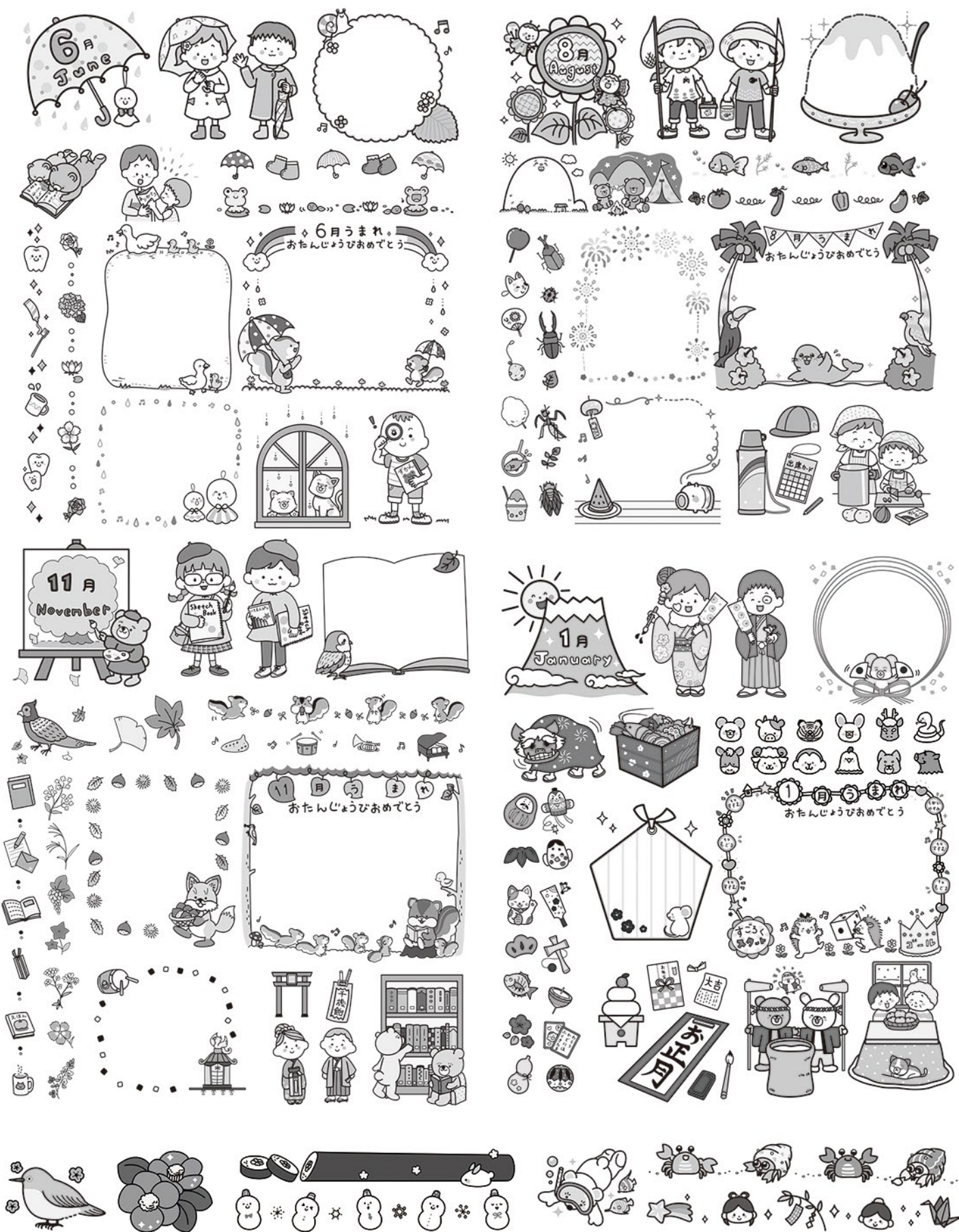
▲学研エデュケーショナル様 先生向け冊子『Smile!』イラストコーナー モノクロ(2019)