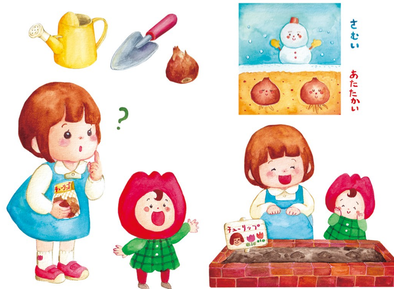
▲オリジナル こんなおしごとがしたい! 展 出展作品 『あきをみつけよう』(2018) tool: 水彩絵の具, Adobe Photoshop