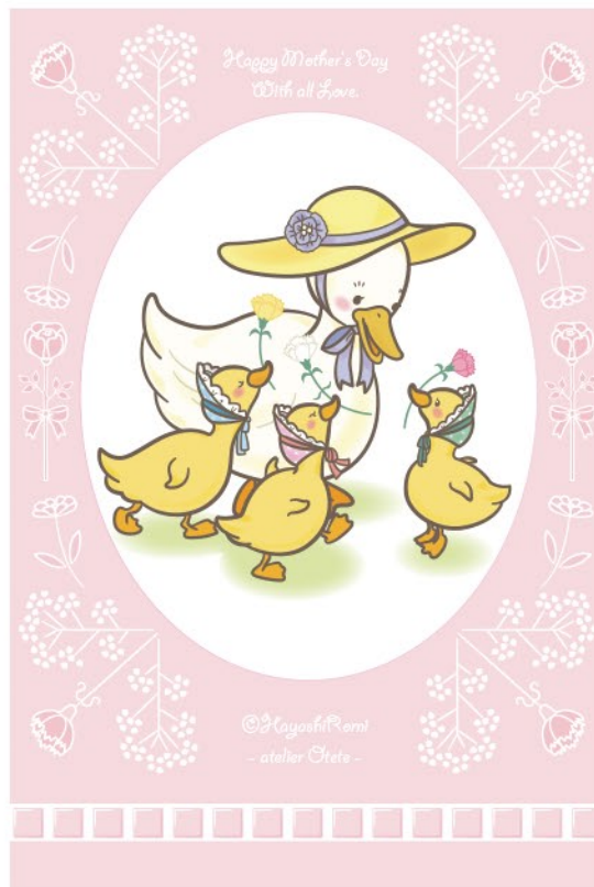
▲オリジナル 『ハッピーバースデー！！』『だいすき、おかあさん』 (2020) tool : Adobe Illustrator