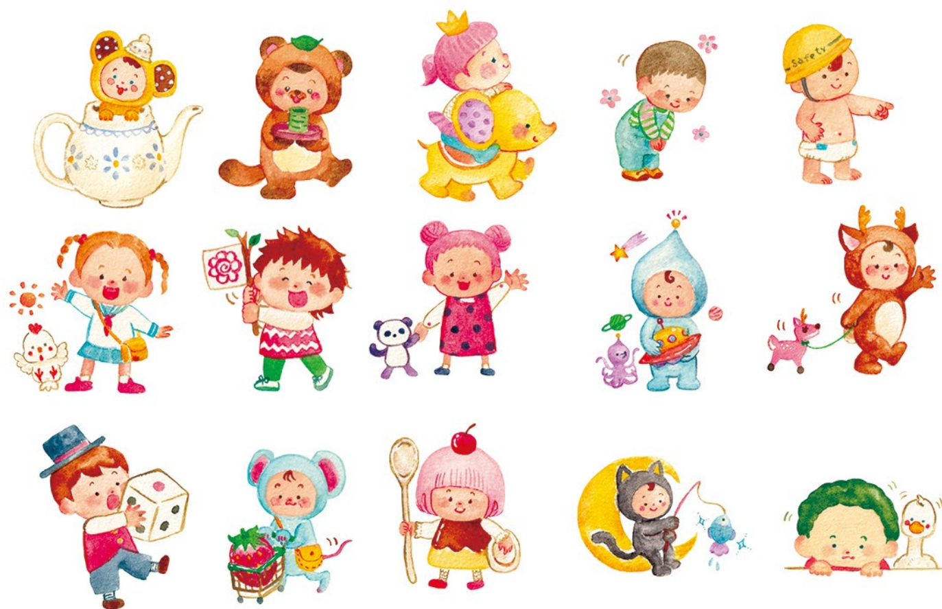
▲オリジナル LINEスタンプ『えほんのこども3』(2020) tool : 水彩絵の具, Adobe Photoshop