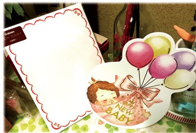
▲学研ステイフル様 ゆりかご型ダイカット ベビーカード用イラスト 表・裏 4C, 中 2C