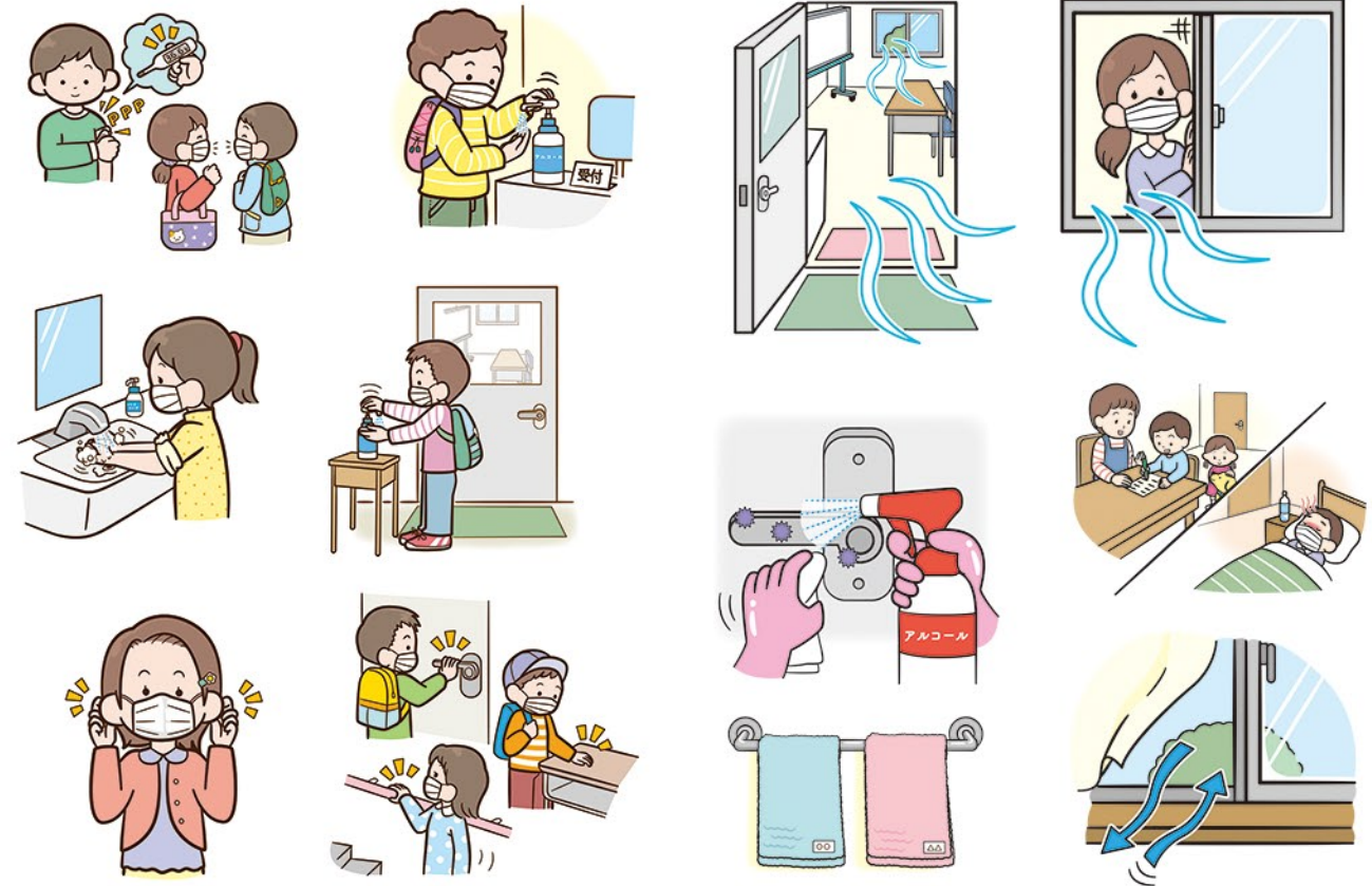
▲教育アライアンスネットワーク様 感染症対策ポスターへのイラスト 4C(2020)