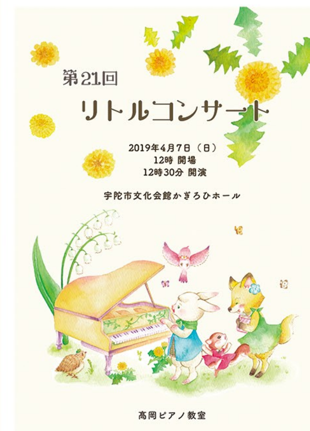
▲高岡ピアノ教室様 コンサート目録表紙