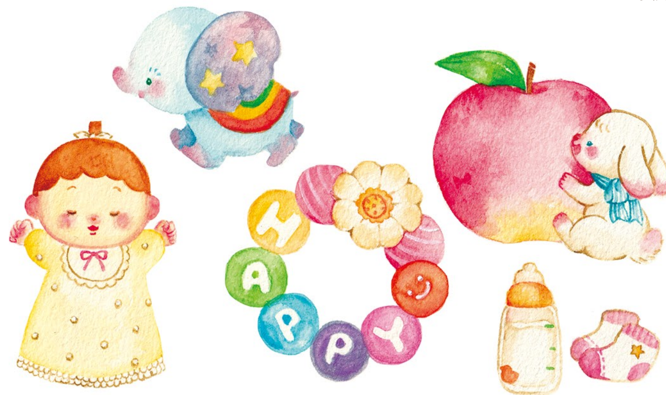
▲オリジナル 『ベビーへのイラスト』 (2019) tool: 水彩絵の具