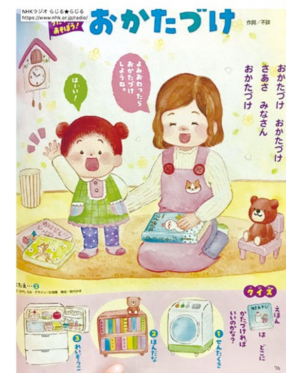
▲フリーベル館様 キンダーブック2『おいもがへんしん!』内 挿絵 4C (2020)